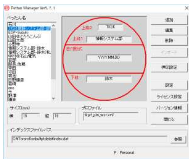
日付印ぺったんの管理ツール

管理者のみが管理ツールを利用できます。押印者は印影登録ができませんのでセキュリティが保たれます。